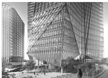
Projet de la Tour Hekla

Le projet Hekla à La Défense, en banlieue nord-ouest de Paris, a eu le feu vert à la suite d'une enquête publique menée en 2016. Ce projet se compose en vérité de deux tours : une petite de 22 étages et une grande de 49 niveaux. La plus petite, appelée Campuséa car elle servira d'une résidence étudiante, sera bientôt terminée. Ses premiers habitants devraient déjà pouvoir s'installer