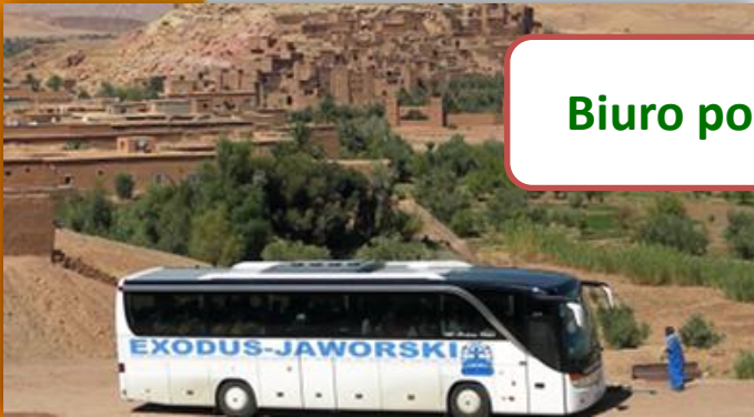
Biuro podróży EXODUS