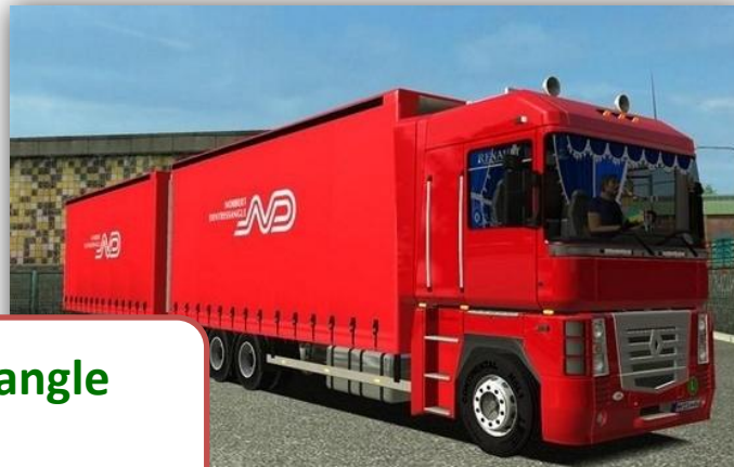
Norbert Detressangle Polska

Wsparcie merytoryczne, finansowe i rzeczowe, organizacja staży i praktyk zawodowych, patronat nad pracownikami szkolnymi