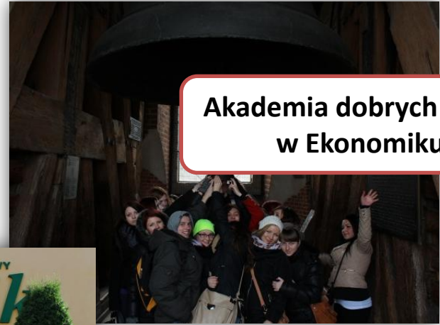
Akademia dobrych praktyk w Ekonomiku III