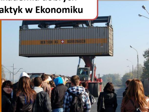
Akademia dobrych praktyk w Ekonomiku