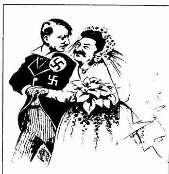
Jak długo potrwa miodowy miesiąc?

20. Przyjrzyj się poniższej karykaturze i wykonaj polecenia A i B. /0-3pkt/